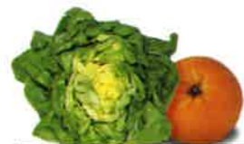
mercado de frutas y hortalizas