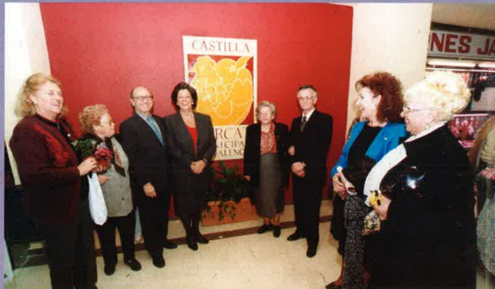
Inauguración obras del Mercado de Castilla.

Los vendedores aseguraron sentirse muy orgullosos de las obras llevadas a cabo en sus instalaciones, porque han supuesto aumentar el número de clientes que acuden asiduamente al Mercado, y han posibilitado ampliar la oferta de productos. En este sentido, el Mercado de Castilla ha sido uno de los pioneros en Valencia a la hora de instalar toda una serie de productos complementarios a los frescos.