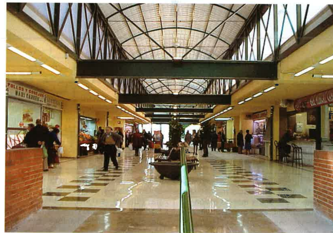
Nueva imagen del Mercado de Castilla.

El pasado cinco de enero, una mascletà a las 10:00 horas daba la bienvenida al rey Melchor al Mercado de Castilla de Valencia. A lo largo de la mañana, Melchor, sentado en su trono, y acompañado de su paje personal, recibió a todos los niños del barrio que se acercaron a verle. Tras hacerse una foto con ellos, les hizo entrega de un juguete.