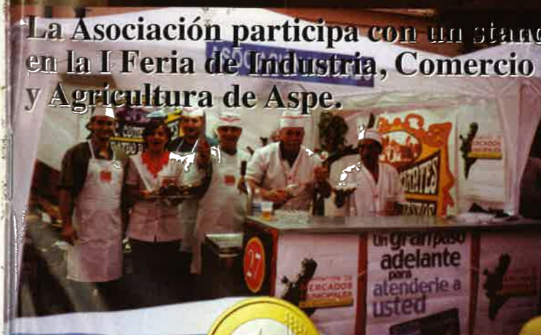
La Asociación participa con un stand en la I Feria de Industria, Comercio y Agricultura de Aspe.

La Asociación de Mercados Municipales ante los nuevos retos inaugura dos nuevos mercados: Castilla y Sedavi.